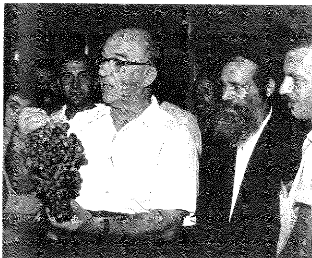
אשכול ואשכול. שר האוצר מבקר בתערוכת הפרי

כלומר, ל"איש ברחוב" לא היה מקום לחשש כי משהו יסודי מטריד את מנוחת קברניטי הכלכלה. נוסף לכך, היה שיפור בשנת 1961 במספר