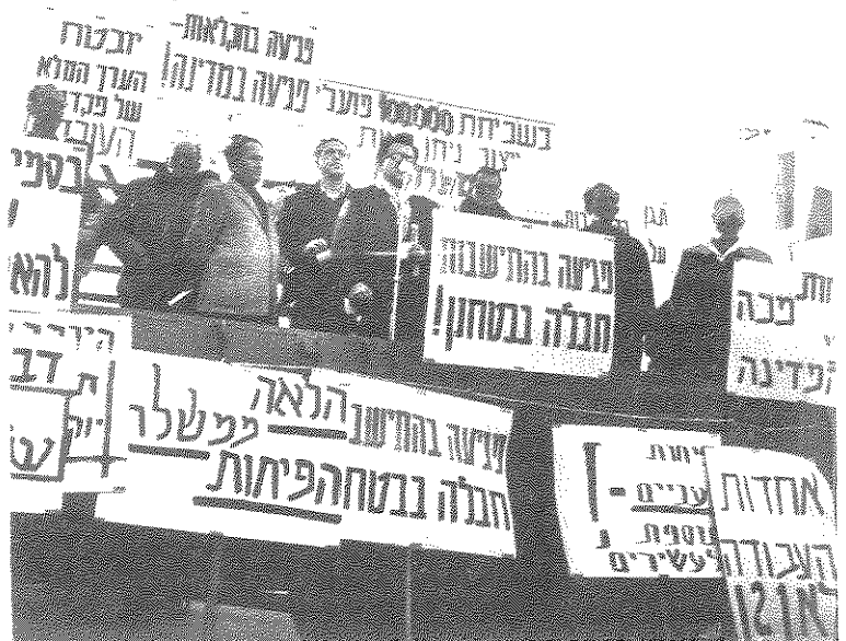
כמה היו בהפגנה? לפי אחת הכרזות בהפגנה עצמה השתתפו בה 100 אלף פועלים

הקו הכללי היה שהן המדיניות הכלכלית בכללותה והן התוכנית החדשה הן הוכחה חותכת לכשלונה של הממשלה. י. חזן: "הממשלה הביאה את משק הארץ עד משבר" (על המשמר, 12.2.62). מ. בגין: "מפא"י הוכיחה באופן סופי שאינה מסוגלת לנהל את המדינה" (חרות, 15.2.62).